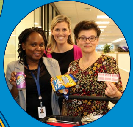
Joyeux semaine de la Fondation OMERS

135 PAYROLL DONORS 156 EMPLOYEE VOLUNTEERS 100 GRANT APPLICATIONS