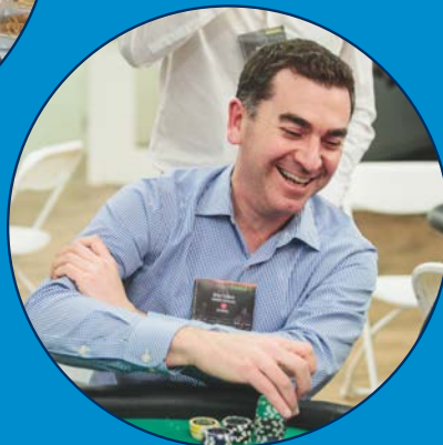
Tournoi de poker de bienfaisance d'OMERS Ventures