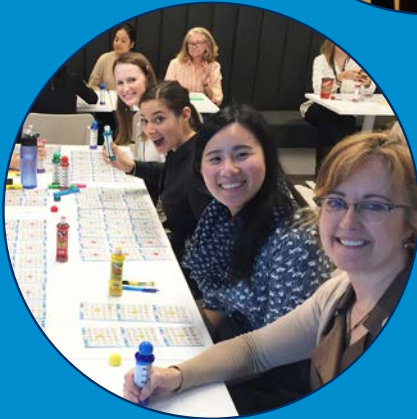
OMERS Bingo Day

135 PAYROLL DONORS 156 EMPLOYEE VOLUNTEERS 100 GRANT APPLICATIONS