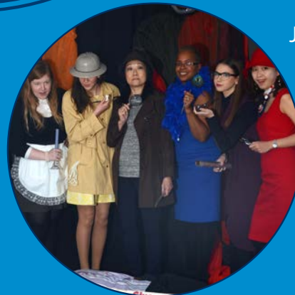
OMERS Diner d'Halloween de la Fondation OMERS