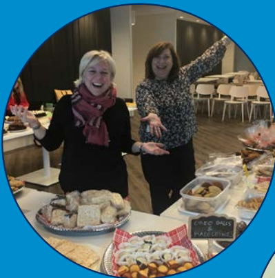
OMERS Foundation Week Bake Sale